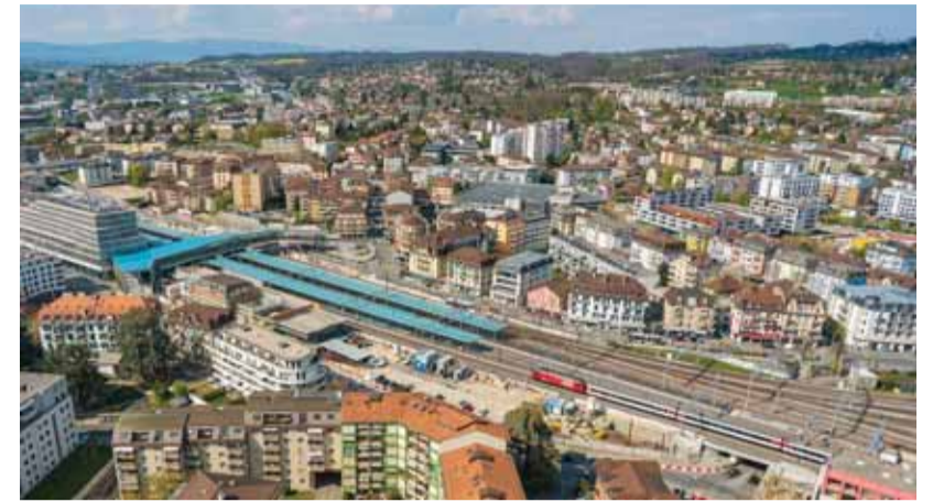
75% des personnes sondées affirment que leur travail à la Ville de Renens a du sens.

SONDAGE • Les résultats de l'étude Friendly Work Space - Job Stress Analysis (JSA) réalisée durant l'automne 2023 par la Ville de Renens viennent de tomber et ils sont globalement positifs. Au total, 231 employés ont participé à l'étude sur 335 sollicités, ce qui correspond à un taux de participation de 68% qui peut être qualifié de «bon» dans la mesure où il permet de donner de la crédibilité aux informations collectées. Le Job Stress Index (JSI) de 51.9 obtenu par la Ville de Renens, proche de la moyenne nationale (50.7), laisse entrevoir un environnement de travail où le rapport entre ressources et contraintes favorise le bien-être des employés. En outre, 75% des personnes sondées affirment que leur travail à la Ville a du sens à leurs yeux, et que l'ambiance au travail est «bonne». De son côté, la Municipalité a annoncé qu'elle proposera des actions transversales sur le renforcement du bien-être au travail. ■